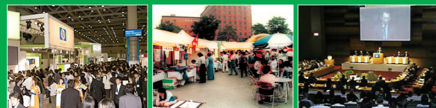
1 ベンチャービジネス・サポート (見本市出展) 2 各種団体サポート (地域振興フェスティバル) 3 行政機関サポート (国際会議)

ΣPR では、特定分野として、ベンチャー企業、各種団体、行政機関に対するソリューション・サービスを提供しています。