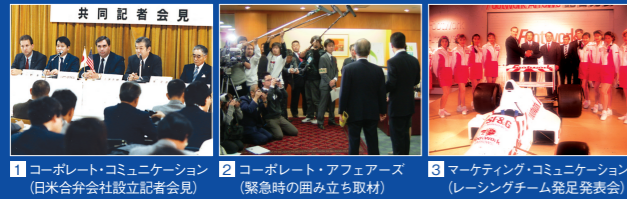
1 コーポレート・コミュニケーション (日米合弁会社設立記者会見) 2 コーポレート・アフェアーズ (緊急時の囲み立ち取材) 3 マーケティング・コミュニケーション (レーシングチーム発足発表会)

ΣPR は、顧客企業・団体に対し、一般社会からグッドウィルを獲得するためのコーポレート・コミュニケーションを支援するとともに、一方、築いた信頼・イメージが損なわれないようコーポレート・アフェアーズを支援します。また、マーケティングに資するマーケティング・コミュニケーションを提供します。